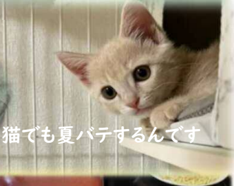
猫でも夏バテするんです