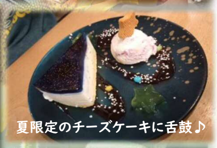
夏限定のチーズケーキに舌鼓♪