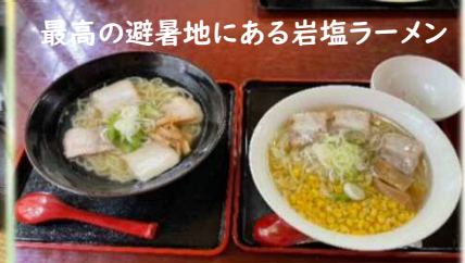
最高の避暑地にある岩塩ラーメン