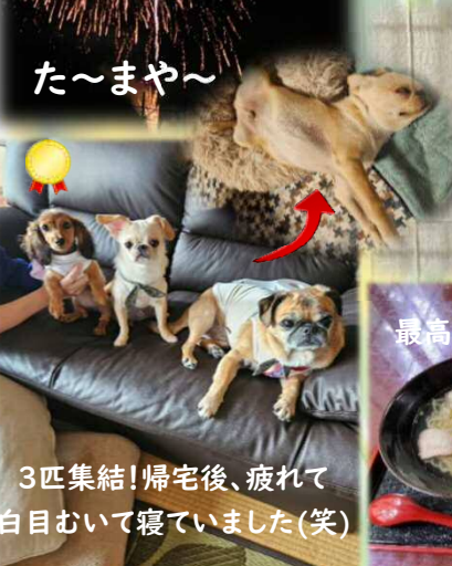
3匹集結!帰宅後、疲れて 白目むいて寝ていました(笑)