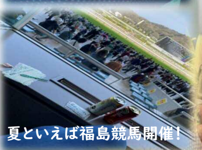
夏といえば福島競馬開催!