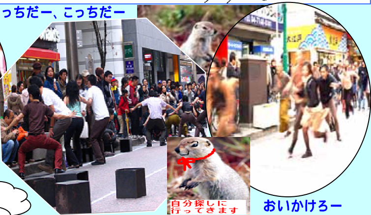
そっちだ一、こっちだ一