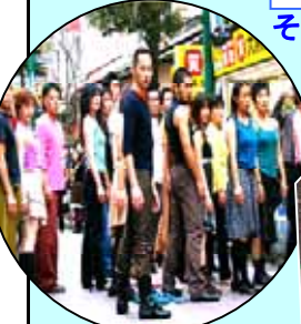
逃がすんじゃねえど