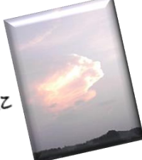
雲が大きな手に見え 思わず「パッパッ」

先日のサッカーワールドカップ の熱狂ぶり最高でした!! 予敗敗退であろうという 前評判を覆しベスト4 には入れたがたが良く やりました。日本代表 最高、次回ブラジル大会 が楽しみです。 営業 前田