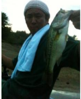
久々に40オパーの ブラックバスを釣り 上げました。V(^^)V